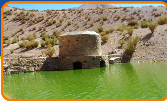
Laguna Chica, sector cordillarano

El proyecto contempló, el reemplazo de 40 luminarias por focos tipo LED y el reemplazo de 30 postes galvanizados, además de un anexo de obra, que contempla la modificación de la alimentación trifásica del alumbrado, hacia la casa de válvula.