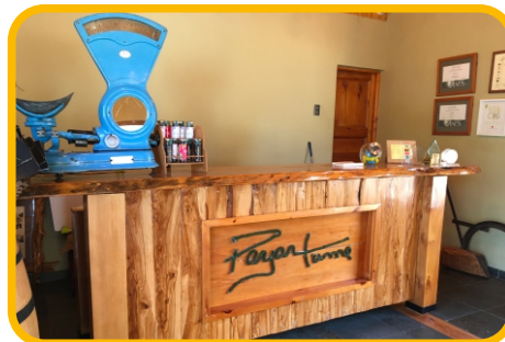
Sala de ventas

Datos de contacto: sitio Web: www.payantume.cl , celular: +56982055960, correo electrónico: hola@payantume.cl , dirección: parcela 5 A Bellavista, Huasco Bajo, Instagram: @payantume .