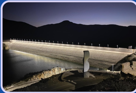
Embalse Santa Juana